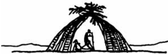
A cabana primitiva segundo Oscar Niemeyer

Habitar entre o céu e a terra, significa, assim, estabelecer na natureza lugares artificiais, adaptados aos processos e aos meios de sobrevivência e de conforto que, em cada sistema cultural dominam e determinam um imaginário colectivo. A arquitectura das culturas primitivas pode, deste modo, ser interpretada como sendo a compreensão da natureza, definida em termos de facto, ordem, carácter, luz e tempo.